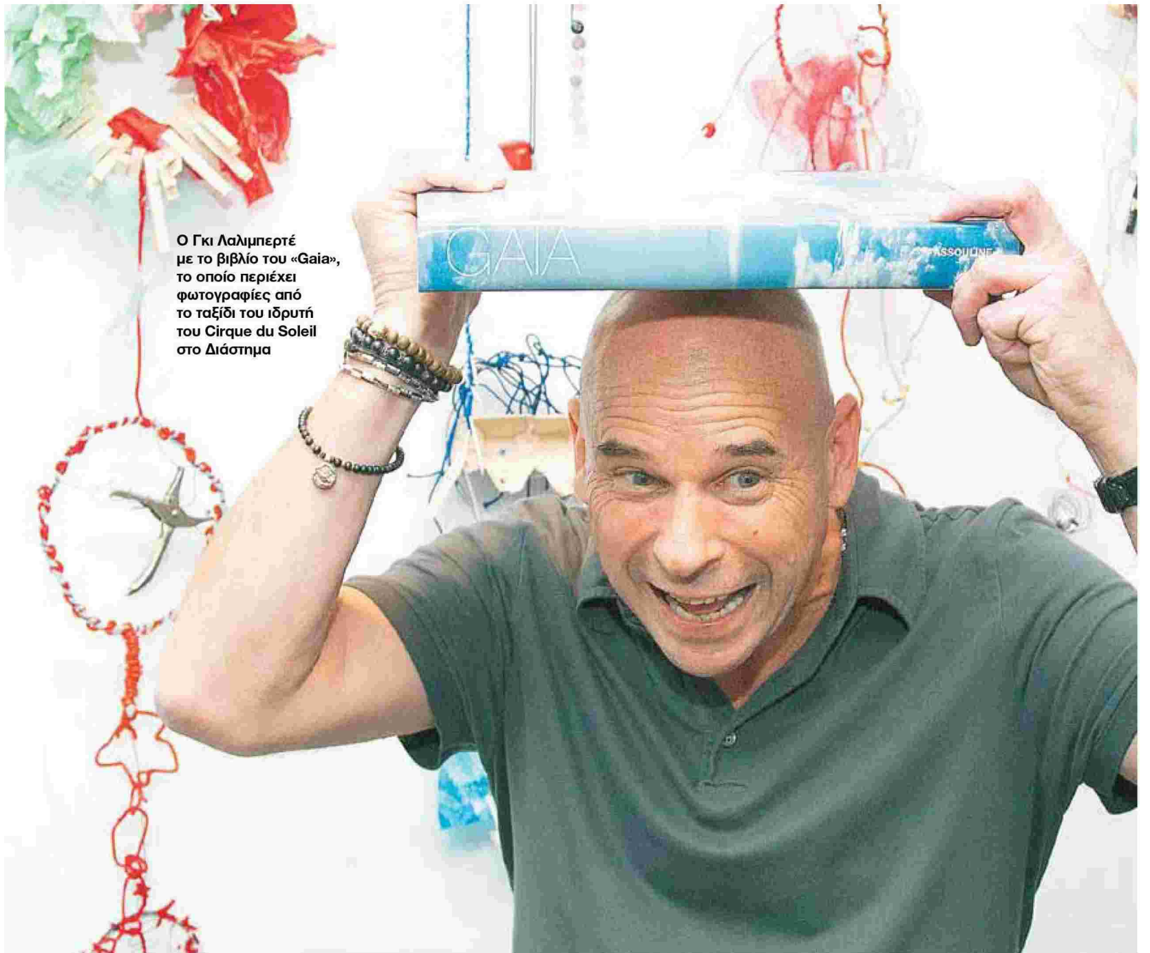
Ο Γκι Λαλιμπερτέ με το βιβλίο του «Gaia», το οποίο περιέχει φωτογραφίες από το ταξίδι του ιδρυτή του Cirque du Soleil στο Διάστημα

Μικρός το έσκαγε από το σπίτι του για να παίξει ακορντεόν και φυσαρμόνικα και να περπατήσει με ξυλοπόδαρα στους δρόμους του Κεμπέκ. Αυτή την αγάπη για ταξίδια και ψυχαγωγία τη μετέτρεψε σε καλλιτεχνική έκφραση υψηλών προδιαγραφών επαναπροσδιορίζοντας τον ορισμό του θεάματος του τσίρκου. Χάρη στη δημιουργική του «τρέλα» η εντυπωσιακή «Alegria!» του φαινομένου που λέγεται Cirque du Soleil έρχεται να δώσει τον τόνο και στη δοκιμαζόμενη Ελλάδα, ενώ ο ίδιος κάνει τουρισμό στο Διάστημα