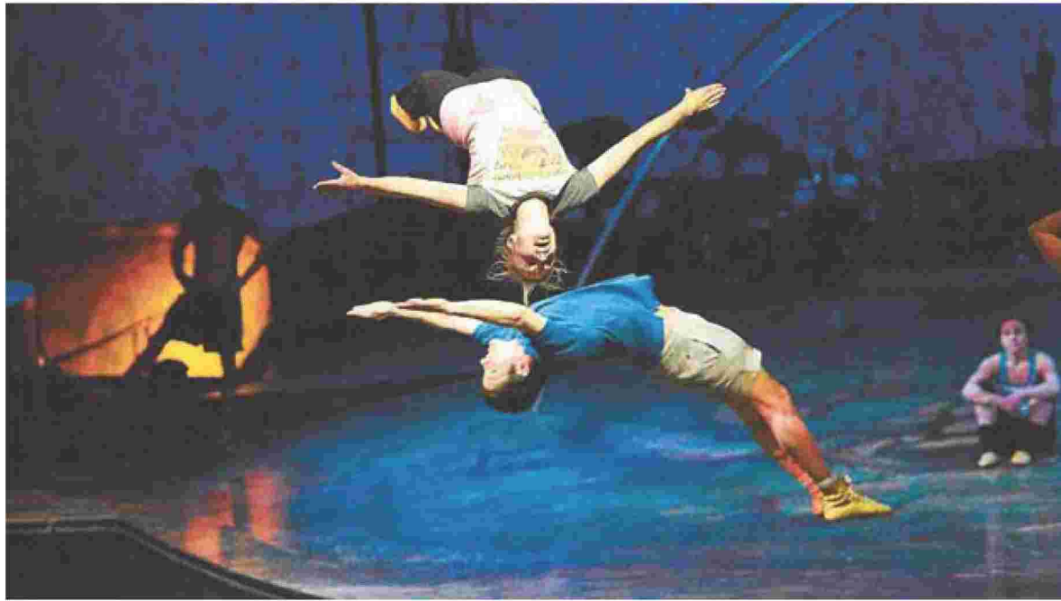
Θεαματικά στιγμιότυπα από τις παραστάσεις του Cirque du Soleil